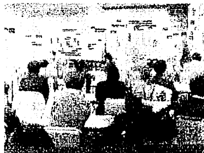
第2日セッション情景

・名簿の整備中ですので、住所・所属・連絡先電話およびFax番号、あるいは E-mail アドレスの変更などございましたらご連絡ください。