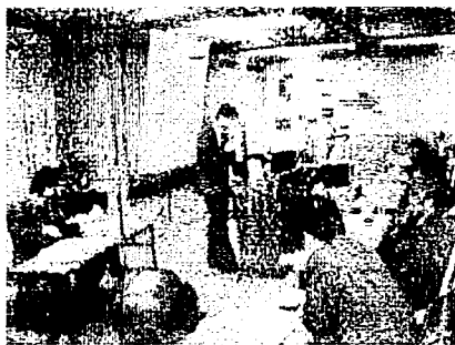
学際パネルの情景