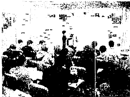
第2日セッション情景

yagi@econ.kyoto-u.ac.jp までご連絡ください。なお、学会ホームページ( http://www.econ.kyoto-u.ac.jp/societies/evolution ) も一度ごらんください。